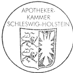
Gerd Ehmen Präsident

Genehmigt aufgrund des § 40 Abs. 4 und § 77 Abs. 3 des Berufsbildungsgesetzes.